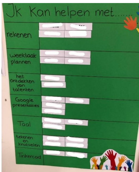
Het ik kan helpen bord, waarop iedereen een plek heeft.

Vanzelfsprekend is het belangrijk dat iedereen vanaf de start het gevoel heeft er echt toe te doen. Dus zorg ervoor dat ALLE ideeën worden benut, juist ook die van een enkeling of minderheid. Laat kinderen in kleine groepen onderzoeken hoe de diversiteit in wensen gerealiseerd kan worden. Alleen dan werk je samen aan het inrichten van een leeromgeving waarin iedereen zich thuis voelt. Een omgeving waarin iedereen een taak krijgt vanuit wie hij/zij is en wat hij/zij goed kan. Een omgeving ook waar verschillen worden gezien als uitbreiding van mogelijkheden. Help kinderen een idee krijgen welke taak zij hebben, waar zij sterk in zijn en faciliteer dat dit benut kan worden. Kennis over elkaar versterkt bovendien de verbondenheid en laat op een positieve wijze zien hoe je afhankelijk van elkaar bent in het positief functioneren als groep. Het in beeld brengen wat kinderen zelf kunnen, maakt bovendien jouw taak in deze groep zichtbaar; waarvoor jij er bent.